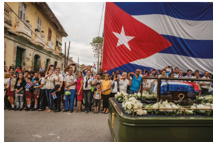
Cuba au précipice du changement Find this photo series.

Quelle impression avez-vous de Cuba lorsque vous regardez cette série?