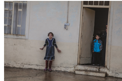
Trouvez cette photo et n'oubliez la légende qu'après avoir répondu à la première question. Offensive sur Mossoul

Pourquoi est-il important pour les journalistes et photojournalistes de travailler librement dans les pays qu'ils exposent?